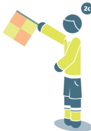
Nuošalė tolimoje aikštės dalyje