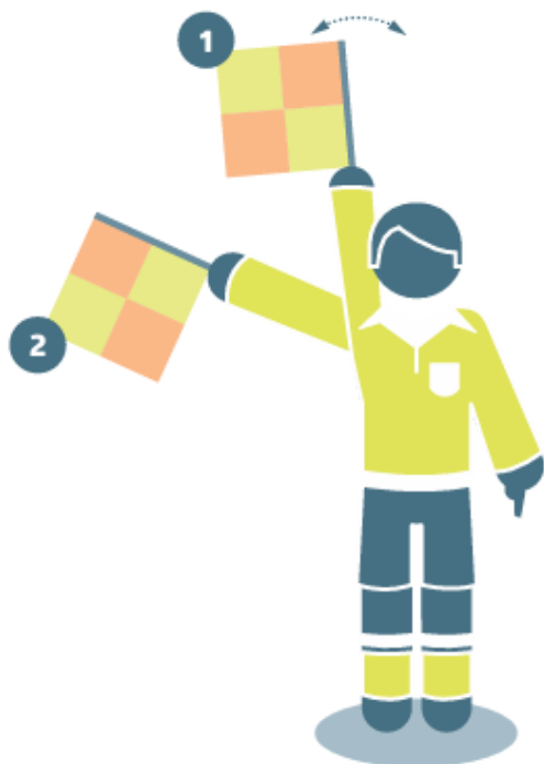
Pražanga atakuojančios komandos naudai