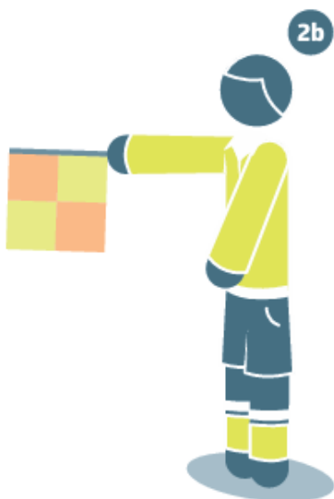
Nuošalė vidurinėje aikštės dalyje