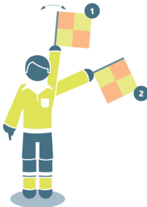
Pražanga besiginančios komandos naudai