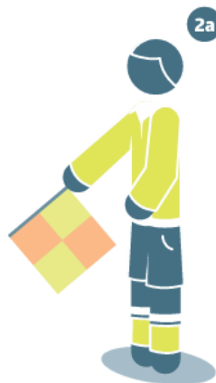
Nuošalė artimoje aikštės dalyje