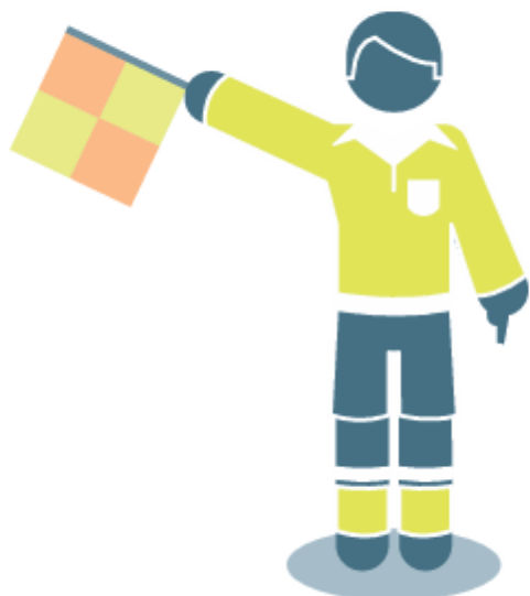
Užribis atakuojančios komandos naudai